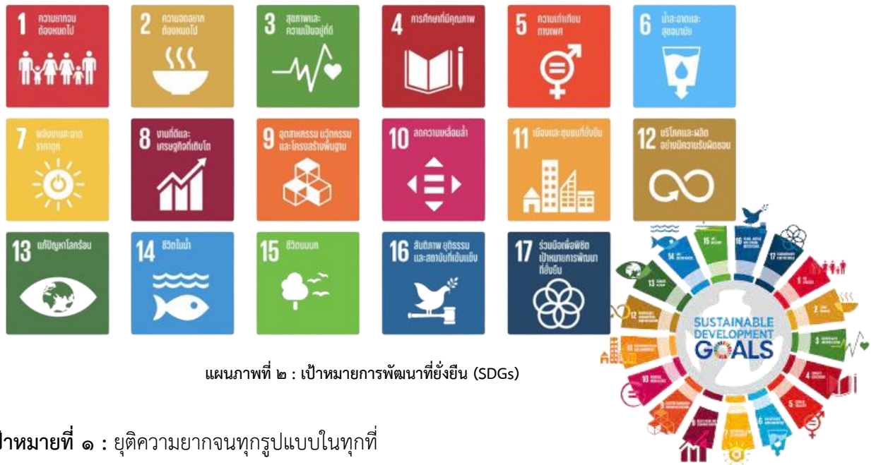
แผนภาพที่ ๒ : เป้าหมายการพัฒนาที่ยั่งยืน (SDGs)

เป้าหมายที่ ๑ : ยุติความยากจนทุกรูปแบบในทุกที่