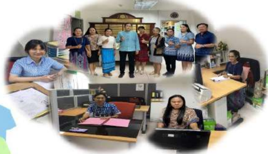
โครงการสวมใส่ผ้าไทยทุกวันศุกร์