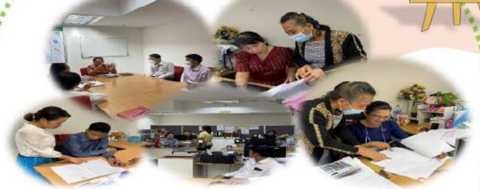
โครงการสอนงานหลักสูตรความรู้ที่จำเป็นใน การปฏิบัติงาน สำนักงานคณะกรรมการ ช่างรังวัดเอกชนตามแผนการดำเนินงาน ประจำปีงบประมาณ พ.ศ.2567