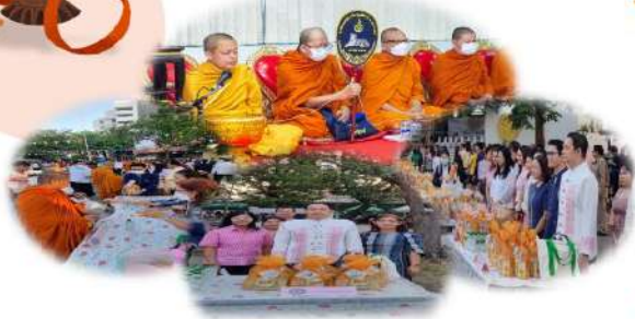
กิจกรรมเข้าร่วมงานพระราชพิธี รัฐพิธี และพิธีในวามสำคัญต่างๆ