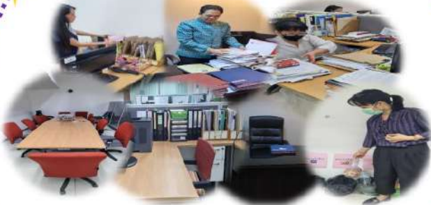
โครงการกิจกรรม 5.ส. สำนักงานคณะกรรมการช่างรังวัดเอกชน