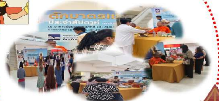
โครงการทำบุญตักบาตรทุกวันพุธ