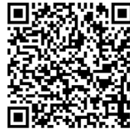
หนังสือขอสละสิทธิ์ฯ

๑. เอกสารตามข้อ (๑) – (๗) ให้รับรองสำเนาถูกต้องทุกฉบับ ด้วยปากกาลูกลื่นสีน้ำเงิน