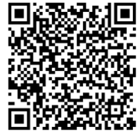
แบบใบรับรองแพทย์

สามารถสอบถามรายละเอียดเพิ่มเติมได้ที่ ฝ่ายบรรจุและแต่งตั้ง โทร. ๐ ๒๑๔๑ ๕๙๓๐