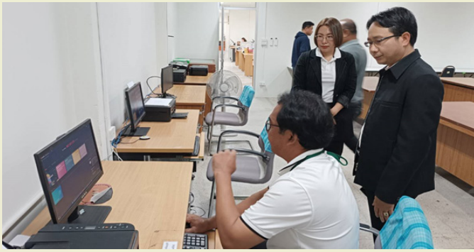
โกศล พลโยธา ผู้ตรวจราชการกรม เข้าตรวจเยี่ยมและให้กำลังใจเจ้าหน้าที่ศูนย์อำนวยความสะดวกที่ดินจังหวัดอุบลราชธานี-อำนาจเจริญ-ศรีสะเกษ-มุกดาหาร-ยโสธร-สุรินทร์