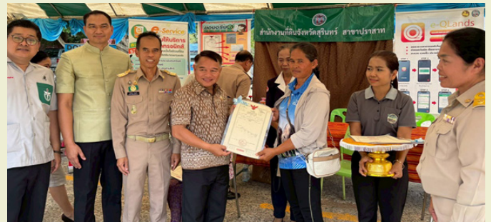
จำเริญ แหวนเพชร ผวจ. สุรินทร์ มอบโฉนดที่ดินให้แก่ประชาชนในโครงการ “จังหวัดสุรินทร์สร้างสุขสร้างรอยยิ้ม” ประจำปีงบประมาณ พ.ศ. 2569 ณ โรงเรียนไตรแก้ววิทยา หมู่ที่ 3 ตำบลกันตวจระมวล อำเภอปราสาท จังหวัดสุรินทร์