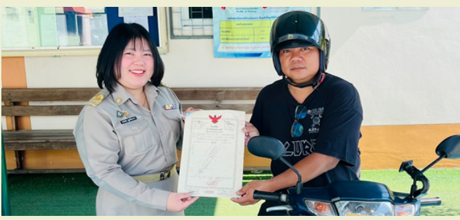
เจ้าหน้าที่ฝ่ายทะเบียน สำนักงานที่ดินจังหวัดกาญจนบุรี สาขาท่าม่วง ให้บริการประชาชนตามโครงการพัฒนาและปรับปรุงประสิทธิภาพการให้บริการด้วยระบบ One Stop Drive ได้ถอนฉบับไว้ รับโฉนดทันที “ไม่ต้องลงจากรถ” ณ สำนักงานที่ดินจังหวัดกาญจนบุรี สาขาท่าม่วง