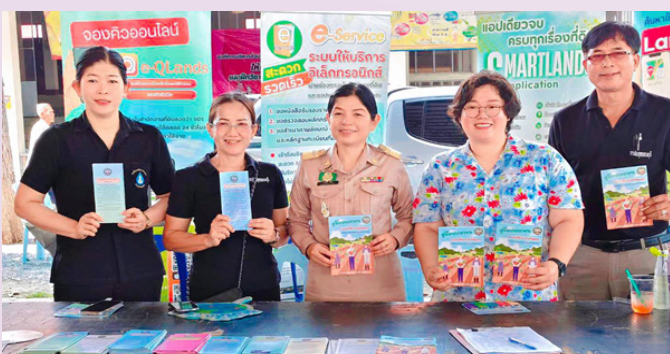
คณะเจ้าหน้าที่สำนักงานที่ดินจังหวัดสุพรรณบุรี ร่วมออกหน่วยให้บริการจังหวัดเคลื่อนที่ ณ วัดราษฎร์บำรุง อำเภอดอนเจดีย์ จังหวัดสุพรรณบุรี