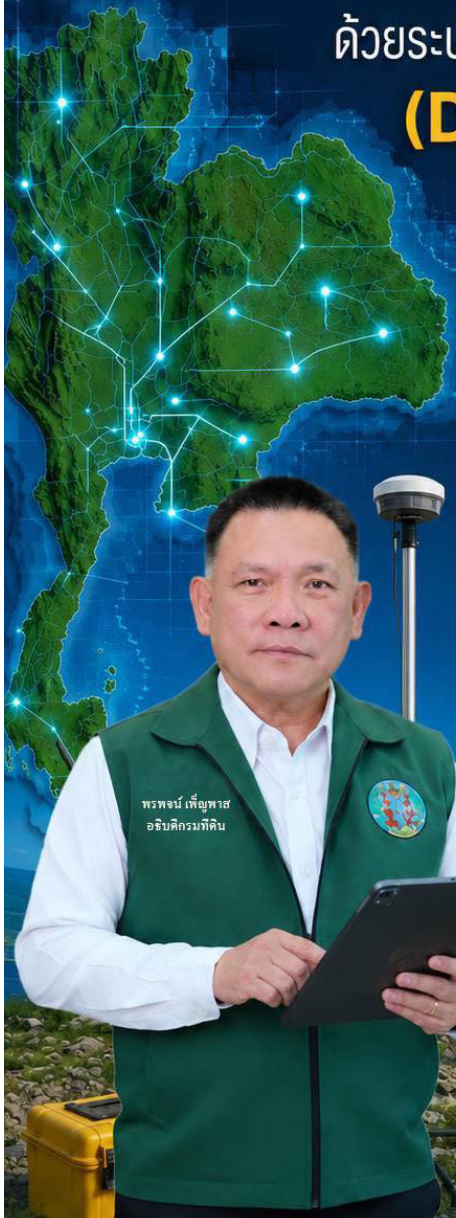
พรพจน์ เพ็ญพาส อธิบดีกรมที่ดิน