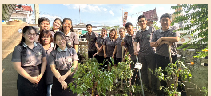
คณะเจ้าหน้าที่ในสังกัดสำนักงานที่ดินจังหวัดลำปาง สาขาเถิน ร่วมกันจัดกิจกรรม วันรักต้นไม้ประจำปีของชาติ พ.ศ. 2569 โดยปลูกต้นไม้ รดน้ำ พรวนดิน และกำจัดวัชพืช ณ บริเวณด้านหลังสำนักงานที่ดินจังหวัดลำปาง สาขาเถิน