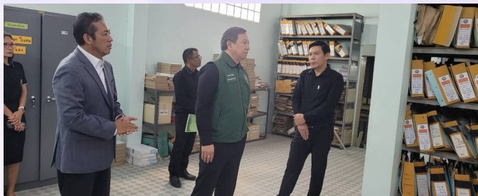
จารุวัฒน์ มณีรัตน์ ผู้ตรวจราชการกรม เข้าตรวจราชการ และมอบนโยบายในการปฏิบัติงาน รอบที่ 2 ประจำปีงบประมาณ พ.ศ. 2569 ให้กับเจ้าหน้าที่สำนักงานที่ดินจังหวัดนครราชสีมา สาขาด่านขุนทด โดยมี วิภพ พลสิทธิ์ จพด.สาขา พร้อมคณะให้การต้อนรับและรับการตรวจ