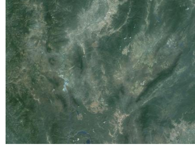
ภาพถ่ายดาวเทียม

ในอดีตแผนที่ส่วนใหญ่เป็นลักษณะการวาดลวดลายสัญลักษณ์แทนภูมิประเทศจริงซึ่งใช้เวลาในการสร้างนาน แต่ในปัจจุบันภาพถ่ายทางอากาศและภาพถ่ายดาวเทียมเข้ามามีบทบาทมาก เนื่องจากราคาถูกลง ใช้เวลาในการสร้างน้อยทำให้ได้แผนที่ที่มีความเป็นปัจจุบันมากขึ้น และผู้ใช้แผนที่สามารถเห็นและเข้าใจแผนที่ได้โดยง่าย