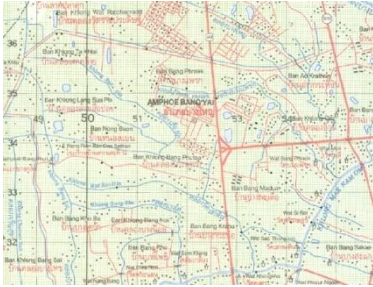
ภาพแผนที่ภูมิประเทศ

แผนที่เป็นเครื่องมือสำคัญในการวางแผนและควบคุมการดำเนินงาน แผนที่ที่เป็นสิ่งที่แสดงลักษณะ ภูมิประเทศบนผิวโลกซึ่งเป็นสามมิติ ให้อยู่ในรูปแบบที่เข้าใจง่ายบนแผ่นกระดาษซึ่งเป็นสองมิติ แผนที่ที่สามารถแบ่งออกได้เป็นหลายประเภทขึ้นอยู่กับวัตถุประสงค์ แต่หากแบ่งตามลักษณะภาพบนแผนที่ จะแบ่งออกได้เป็น ๒ ลักษณะ คือ แผนที่ที่เป็นสัญลักษณ์แทนลักษณะภูมิประเทศต่างๆ และ แผนที่ที่เป็นภาพจริงซึ่งเป็นภาพถ่ายอาจเป็นภาพถ่ายทางอากาศหรือภาพถ่ายดาวเทียมก็ได้