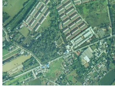
ภาพถ่ายทางอากาศ