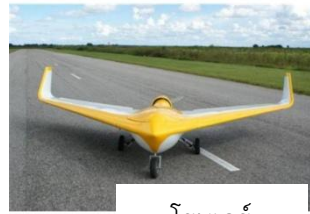
โรเตอร์ ฟิกส์วิง

ยูเอวี สำหรับใช้ในการถ่ายภาพทางอากาศ จะมีลักษณะอยู่ ๒ ประเภท คือ ลักษณะหมุนด้วยโรเตอร์ (เหมือนเฮลิคอปเตอร์) ขึ้นลงในแนวดิ่งได้ ส่วนใหญ่ใช้ถ่ายภาพนิ่ง และภาพเคลื่อนไหว ในที่ไม่ใหญ่มากนัก เป็นการถ่ายภาพมุมสูง เช่น ในการประชุมสัมมนา การแสดงคอนเสิร์ต การแข่งขันกีฬา การจราจร หรือตรวจสภาพป่า เป็นต้น ลักษณะของยูเอวีแบบนี้จะไม่ทนทานต่อแรงลม มีโอกาสสั้นไหวง่าย และลักษณะที่สองจะเป็นแบบเครื่องบินปกติ หรือเรียกว่า ฟิกส์วิง สำหรับใช้ในการถ่ายภาพทั่วไป และมีการประยุกต์มาใช้ในการถ่ายภาพทางอากาศได้