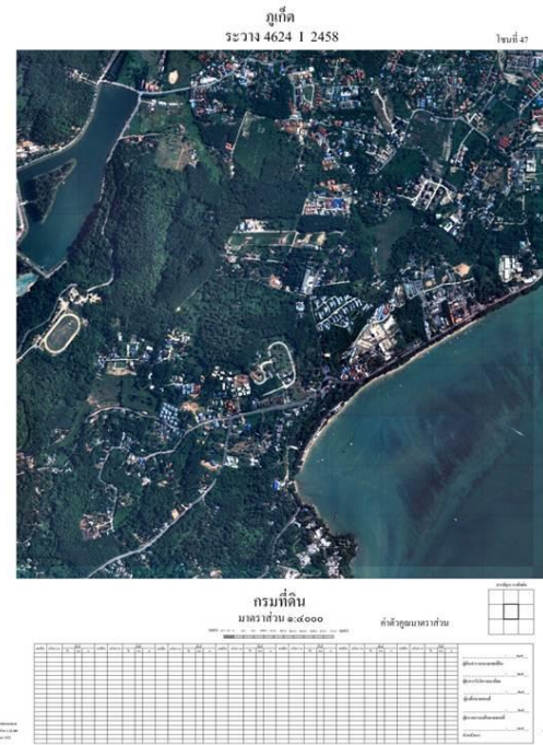
การผลิตแผนที่ภาพถ่ายทางอากาศ