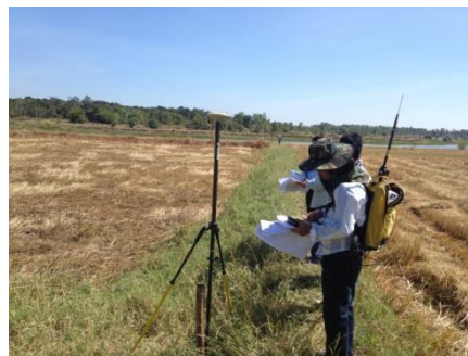
การรังวัดด้วยระบบดาวเทียม RTK