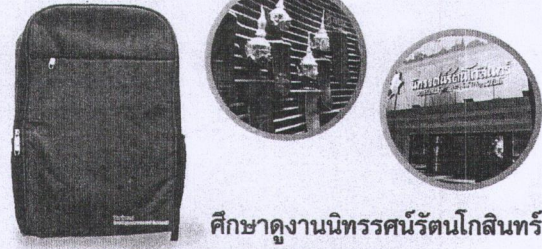
ศึกษาดูงานนิทรรศน์รัตนโกสินทร์