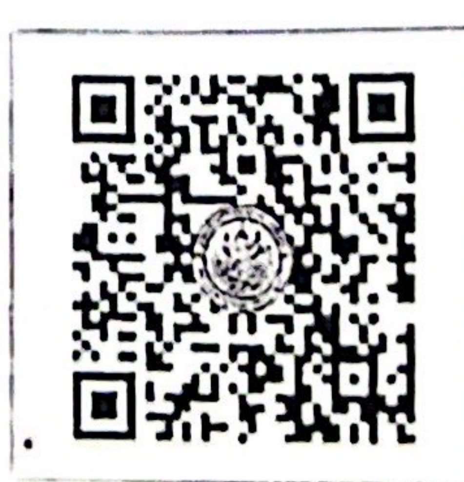
QR-Code เว็บไซต์

สำนักงานบริการวิชาการ มหาวิทยาลัยศิลปากร (ตลิ่งชัน) โทรศัพท์ ๐-๒๑๐๕-๔๖๘๖ ต่อ ๑๐๐๒๖๖