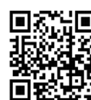
รายละเอียดการรายงานตัว