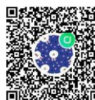
กลุ่ม Line รายงานตัว