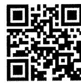
หนังสือขอสละสิทธิ์ฯ

สามารถสอบถามรายละเอียดเพิ่มเติมได้ที่ ฝ่ายบรรจุและแต่งตั้ง โทร. ๐ ๒๑๔๑ ๕๙๓๐