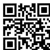
เอกสารแนบ ๑ - ๔