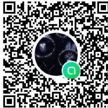
กลุ่มตำแหน่งนักวิชาการที่ดินปฏิบัติการ บรรจุฯ ๒๗ มิ.ย. ๖๘