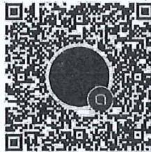
กลุ่มตำแหน่งนักวิชาการที่ดินปฏิบัติการ นักวิชาการแผนที่ภาพถ่ายปฏิบัติการ และนักวิชาการพัสดุปฏิบัติการ บรรจุฯ ๒๗ มิ.ย. ๖๘