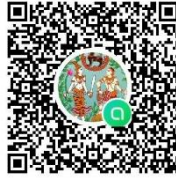
บรรจุ ฯ ๑๘ สิงหาคม ๒๕๖๘ กรมที่ดิน