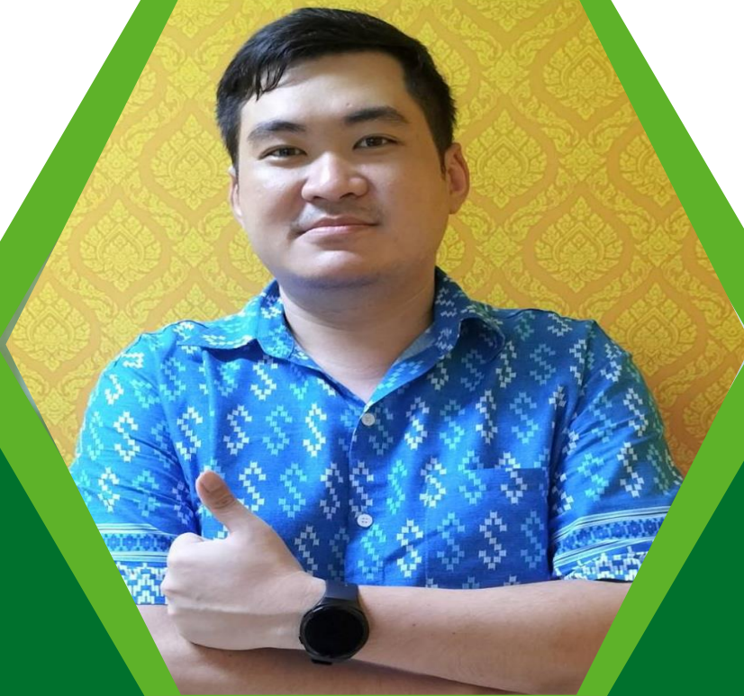
ฝ่ายทะเบียน