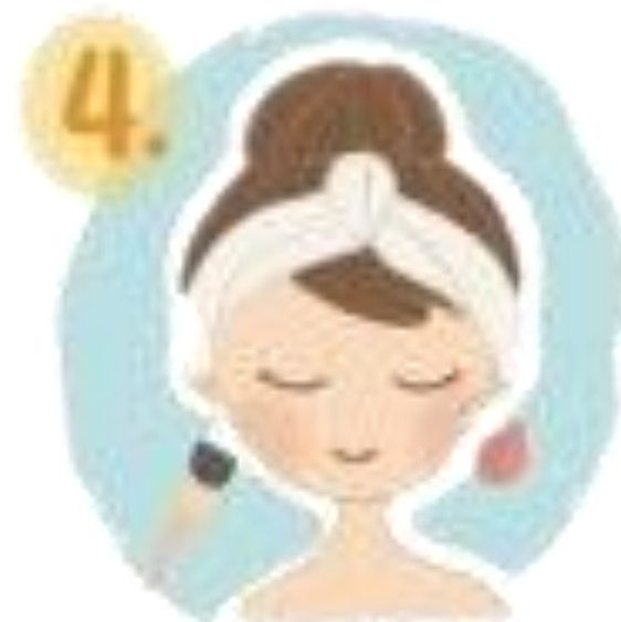
4. ไซปรงหรือฟองน้ำ สรงอัม