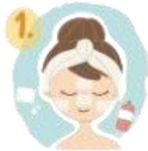
1. ฉีดโทมเนอร์ หรือ เจลบบนสำลี ปะกั้วไว้ 5 นาที