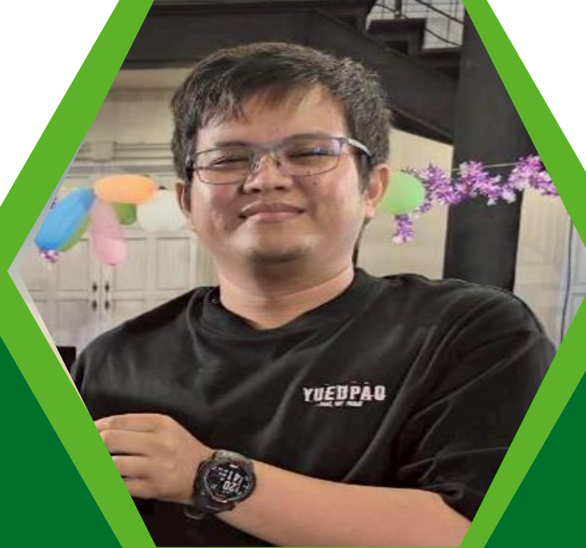
ฝ่ายรังวัด