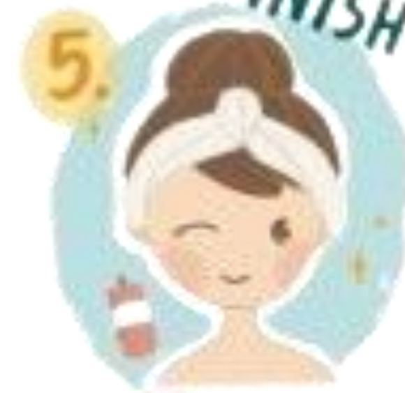
5. ฉีดสเปรย์เพื่อช่วย ลือคเครื่องสำอางค์