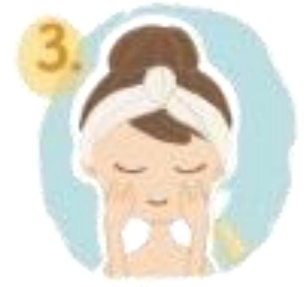
3. สบไฟเบอร์