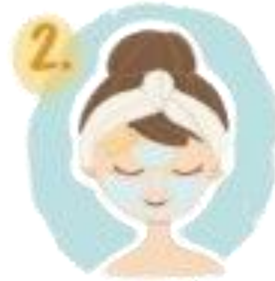
2. สวมอยส์เจอร์ไรเซอร์ ทั่วใบหน้า