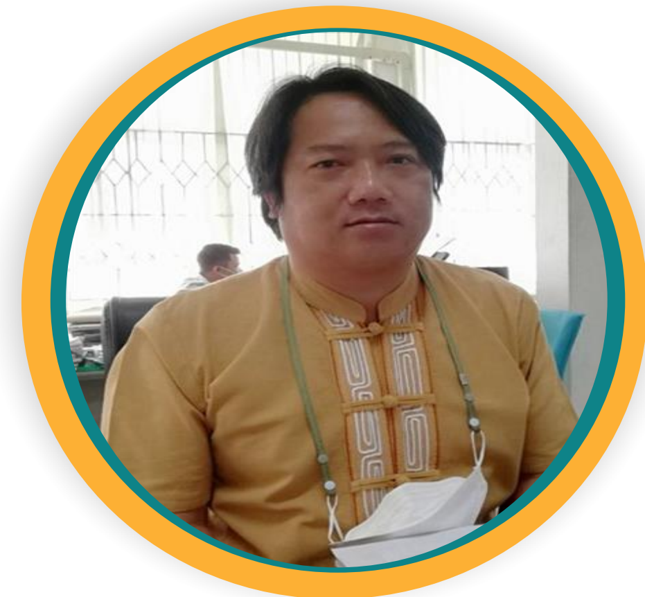
ฝ่ายรังวัด