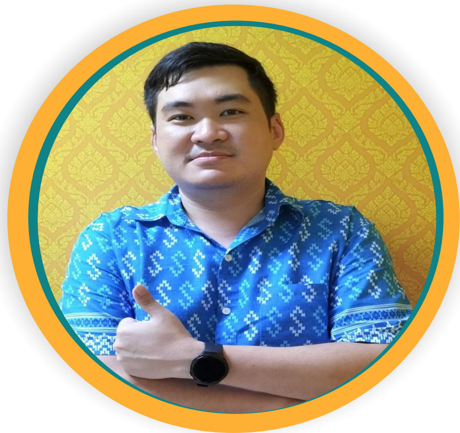
ฝ่ายทะเบียน