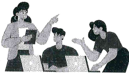
หลักสูตร Smart City กลุ่มประชาชนทั่วไป

เรียนฟรี! เรียนออนไลน์ได้ทุกเวลา ไปศึกษาได้เลย!