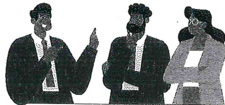
หลักสูตร Smart City (หลักสูตรต่อยอด)