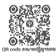
QR code ลงนามปฏิญาณตน

นายสุทธิพงษ์ จุลเจริญ ปลัดกระทรวงมหาดไทย