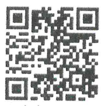
สิ่งที่ส่งมาด้วย