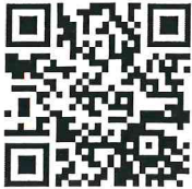
ช่องทางการกรอกข้อมูล

ช่องทางการกรอกข้อมูลพื้นฐาน ข้อมูลผู้ประสานงาน และตอบแบบประเมินตนเองตามเกณฑ์มาตรฐาน GECC (เกณฑ์กายภาพ)