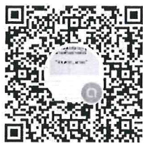
QR code และ link เข้าร่วม open chat

ลิงก์สำหรับเข้าร่วมกลุ่มไลน์ Open chat โปรดคลิกที่ลิงก์ด้านล่าง