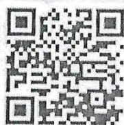
วิธีการทางอิเล็กทรอนิกส์ ระดับเริ่มต้น