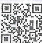
ระเบียบสำนักนายกรัฐมนตรีว่าด้วย งานสารบรรณ (ฉบับที่ 4) พ.ศ. 2564