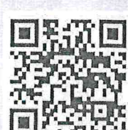
ข้อมูลเพิ่มเติม เกี่ยวกับ พ.ร.บ.ฯ