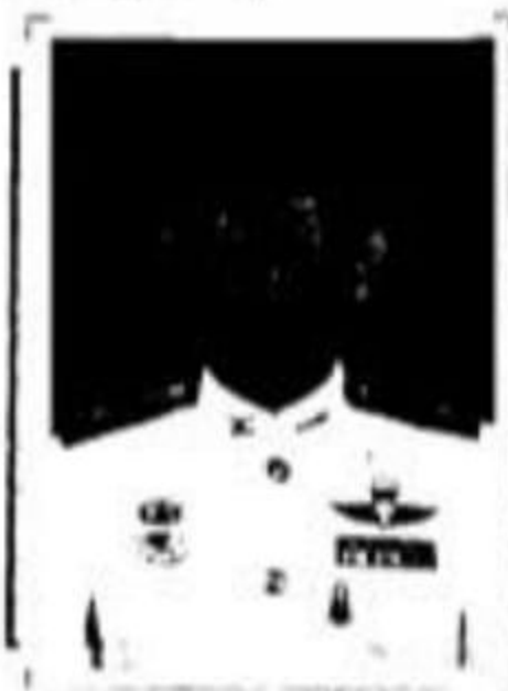
ตัวอย่างลายมือชื่อ