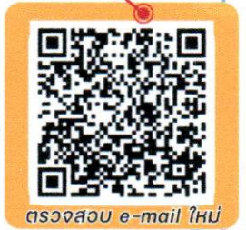
ตรวจสอบ e-mail ใหม่

และหากหน่วยงานของท่านยังไม่ได้ แจ้งเปลี่ยน อีเมล กับกรมส่งเสริมการปกครองท้องถิ่น กรุณาดำเนินการแจ้งข้อมูลได้ที่ สท. 06-3206-1528 หรือ 02 241 9000 ต่อ 1112 , 1116